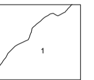
Hranica obvodu PÚ